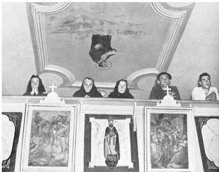
Dans la vie on peut tout faire mais il faut se mouiller.

En ce qui concerne l'organisation des loisirs, il faut absolument une concertation pour savoir ce qui les intéresse. Je pense que les jeunes ont besoin d'évènementiel. Il faut des moments forts dans une cité pour se sentir lié à la cité. Il faut une ville très ouverte avec des gens qui viennent de l'extérieur, des mixités sociales et culturelles.